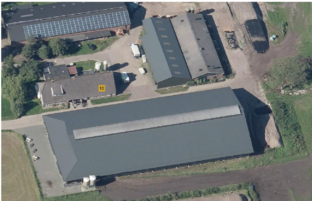
Figuur 1 - Bovenaanzicht locatie

Dit project wordt uitgevoerd op het dak van de nieuwe stal van de maatschap Langenkamp-Niens, op Vennenbergweg 10, 7722 JE Dalfsen. Zon op Vilsteren heeft de formele bevestiging gekregen dat de draagconstructie van het dak voldoende sterk is om het extra gewicht van de zonnepanelen te kunnen dragen.