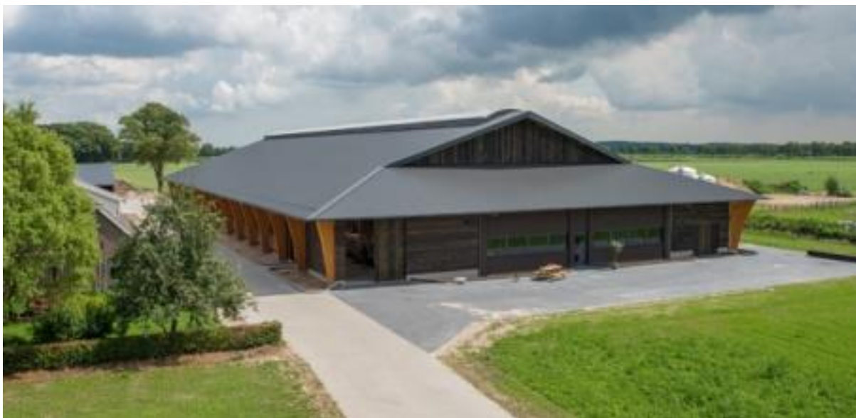
Figuur 2 – Dak van het project Zon op Vilsteren, de stal van Langenkamp