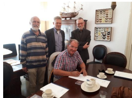
Figuur 1 – Het oprichtingsbestuur