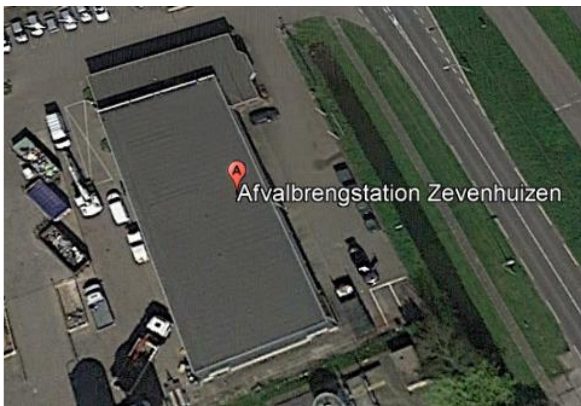
Figuur 4c - Bovenaanzicht locatie Gemeentewerf

NB: u belegt buiten AFM toezicht - er is voor deze activiteit geen vergunnings- en prospectusplicht.