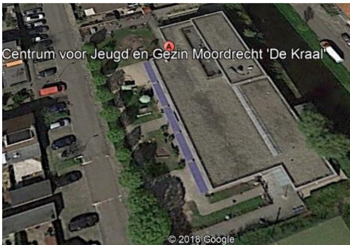
Figuur 2a - Bovenaanzicht locatie De Kraal

Zon op Zuidplas heeft de formele bevestiging gekregen dat de draagconstructie van het dak voldoende sterk is om het extra gewicht van de zonnepanelen te kunnen dragen.