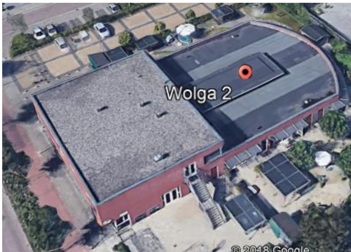
Figuur 3b - Bovenaanzicht locatie Wolga